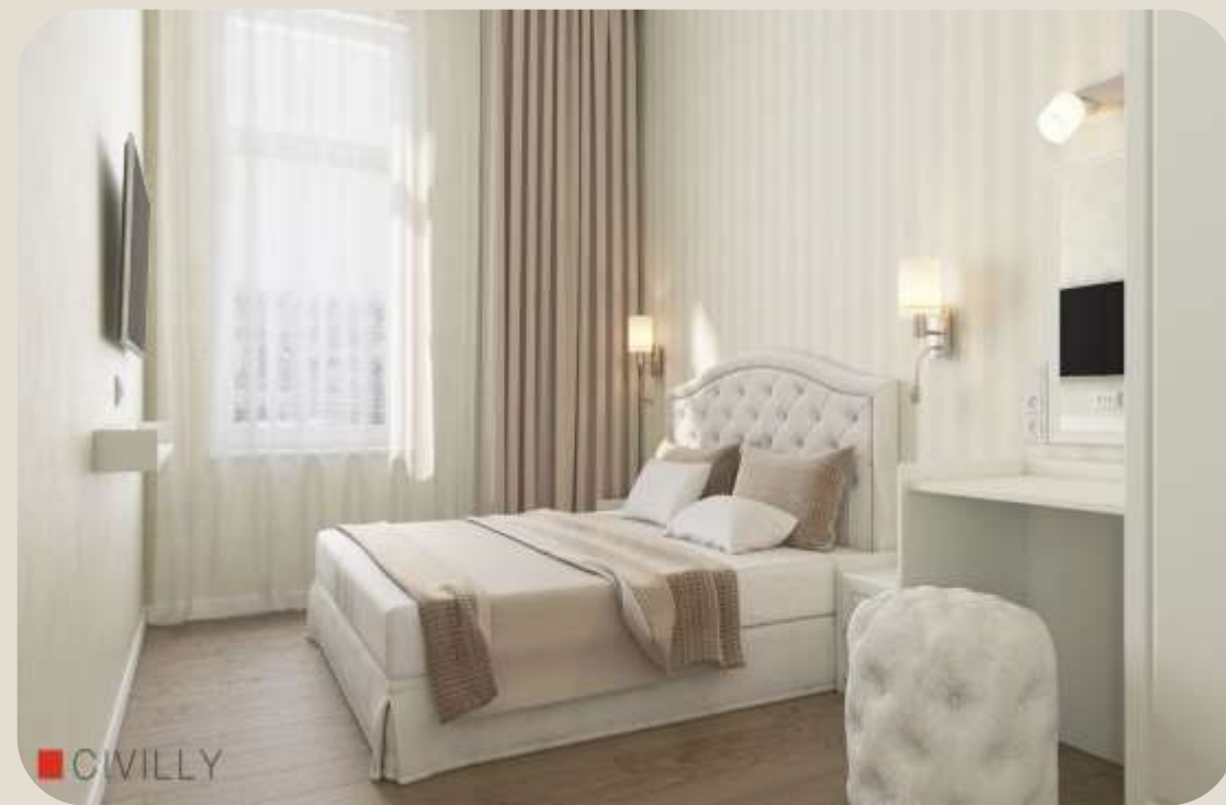
Вигляд з середини