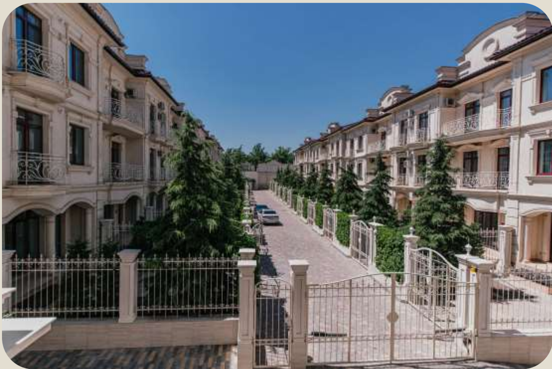
Вигляд з вулиці