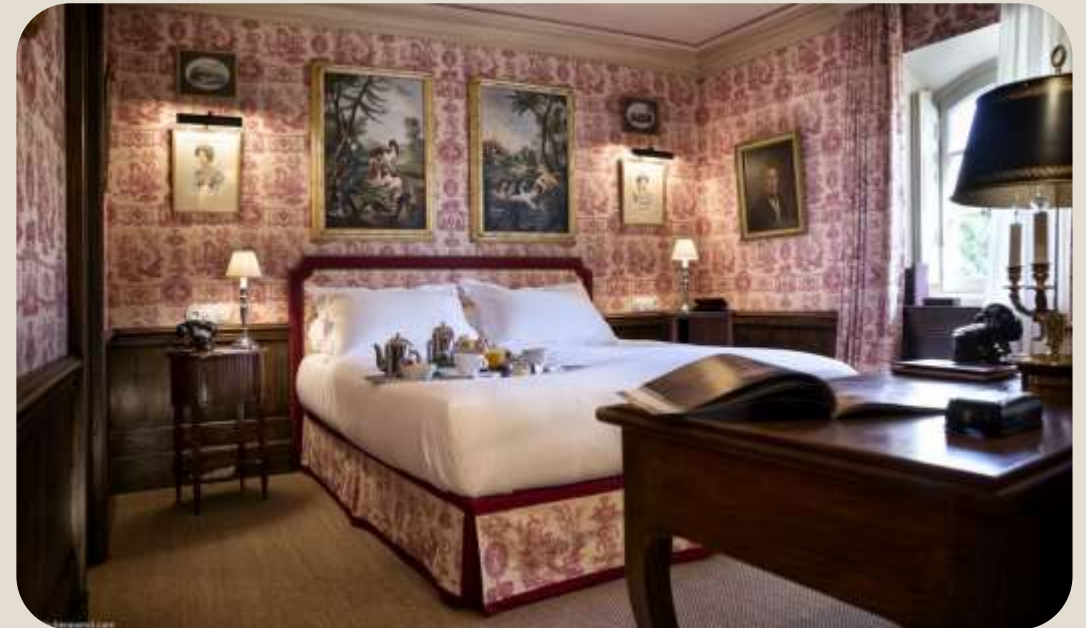
Вигляд з середини