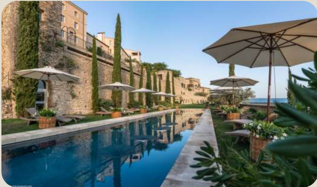
Вигляд з вулиці

La Bastide de Gordes – готель класу люкс у дизайнерському стилі XVIII століття рококо, де кожен куточок просякнутий царською величчю, що дозволяє гостям відчувати себе представниками королівського роду. Готель La Bastide de Gordes має 22 комфортабельних гостьових номери і 17 вишукано оформлених номерів Suite.